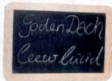
Begrüßung auf Platt: „Guten Tag, liebe Leute“

Wie sieht sie die Zukunft der Sprache? „Plattdeutsch ist Teil der norddeutschen Kultur. Ich möchte helfen, das zu bewahren.“ N. Sorgenfrei