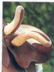
Das „Horn“, auf dem das rechte Bein liegt